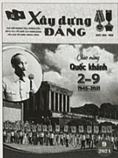
Bìa 1: Chào mừng kỷ niệm 76 năm Quốc khánh nước Cộng hòa XHCN Việt Nam (2-9-1945 - 2-9-2021).

Địa chỉ Số 105B Quán Thánh quận Ba Đình, Hà Nội Điện thoại: 080.45356 Fax: 080.45518